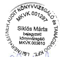
Siklós Márta Teréz